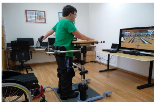
Cvičení ve vertikalizačním stojanu

Nezaháel ani vertikalizační stojan s možností pohybu trupu i končetin. Vertikalizační stojan je propojený s videoprogramy, které simulují sportovní a další pohybové aktivity.