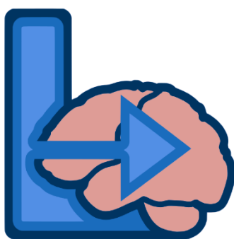
Logo programu Brain In

Na základě spolupráce s Fakultou aplikovaných věd v Plzni získali klienti možnost využívat speciální neurorehabilitační cvičení Brain In, což je počítačový program, který cílí na posilování jejich kognitivních schopností. Dalšími aktivitami jsou kroužek vaření, práce na PC a jiné aktivity.