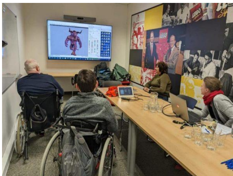
Exkurze v LEGU

V březnu jsme vyrazili na exkurzi do firmy LEGO. Klienti se nejprve účastnili videoprezentace a pak si mohli prohlédnout spoustu modelů v životní velikosti.