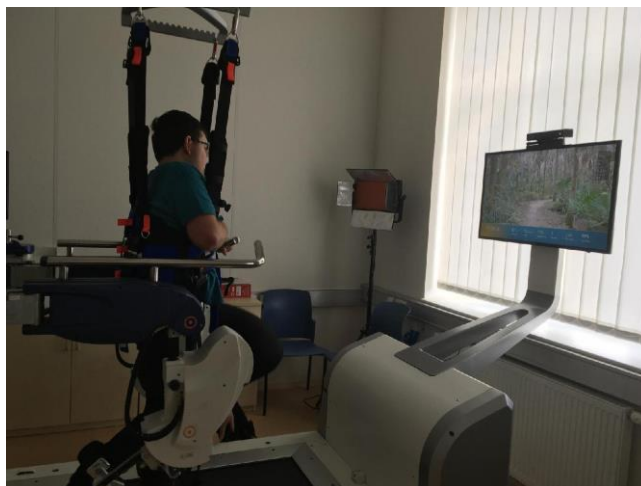
Robotická laboratoř FBMI při ČVUT v Kladně

Nadále trvala spolupráce se studenty z Fakulty biomedicínského inženýrství ČVUT v Kladně. Pod odborným vedením naši klienti cvičili na přístrojích určených na zlepšování pohybu horních končetin s vizuální zpětnou vazbou na monitoru. Dále trénovali chůzi na dvou různých přístrojích pro dolní končetiny. U všech, kteří se programu účastnili, byl zaznamenán pokrok a jejich velký zájem.